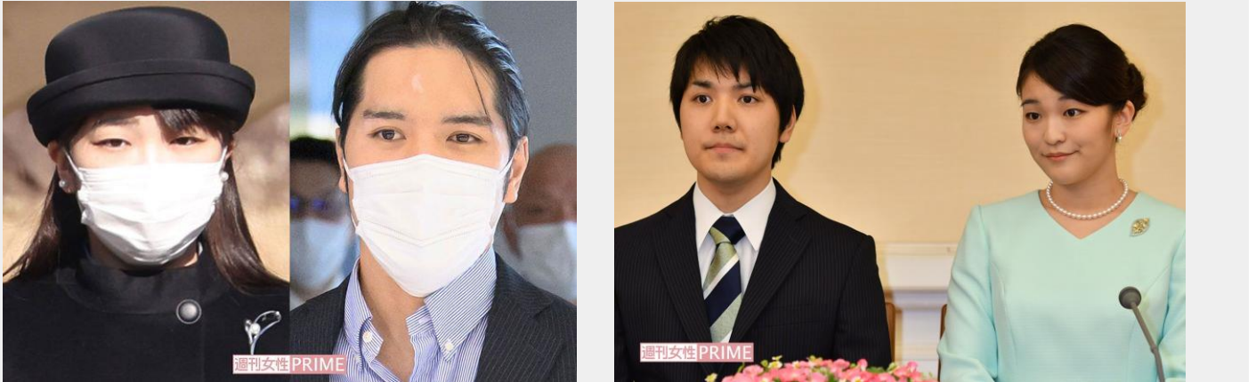
眞子さま（'21年1月）と小室圭さん（'21年9月） ‘17.9 婚約会見

10月26日に眞子さまと小室圭さんが 入籍 し、同日に記者会見が行われると宮内庁から正式に発表された。