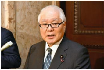
会見する武見敬三厚生労働相=2024年3月5日、東京・永田町