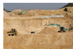
江西省のレアアース鉱山